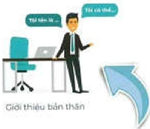
Giới thiệu bản thân