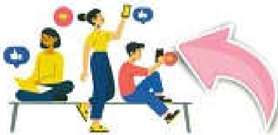
Giảm tương tác trực tiếp