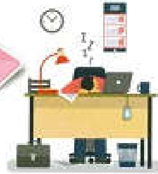
Nguy cơ ảnh hưởng sức khỏe khi sử dụng mạng xã hội quá mức