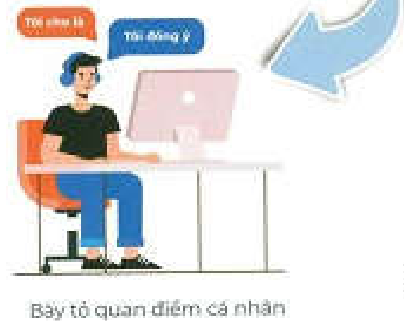
Biểu tỏ quan điểm cá nhân