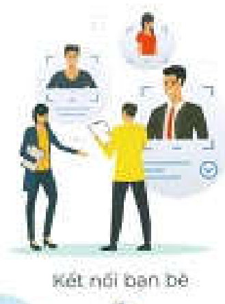
Kết nối bạn bè