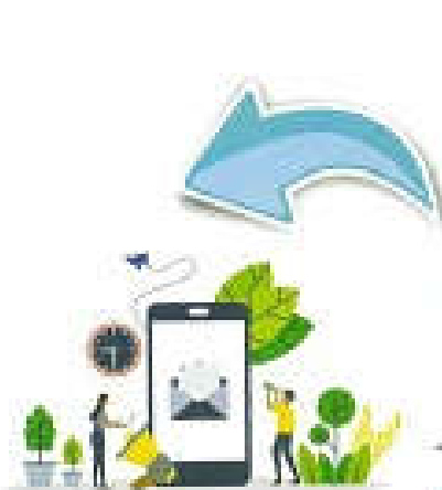
Tìm kiếm thông tin, giải trí, nghiên cứu, trau đổi kiến thức và kỹ năng