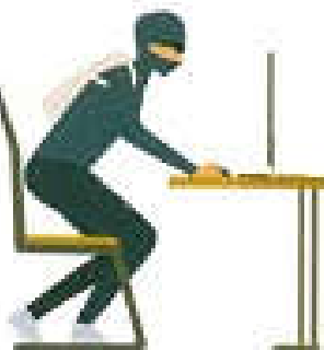
Thiếu riêng tư, lộ thông tin cá nhân