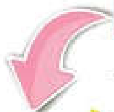
Lãng phí thời gian và xao lãng mục tiêu thực của cá nhân