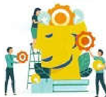
Giúp vận động trí não, lạc quan hơn khi tiếp cận thông tin tốt